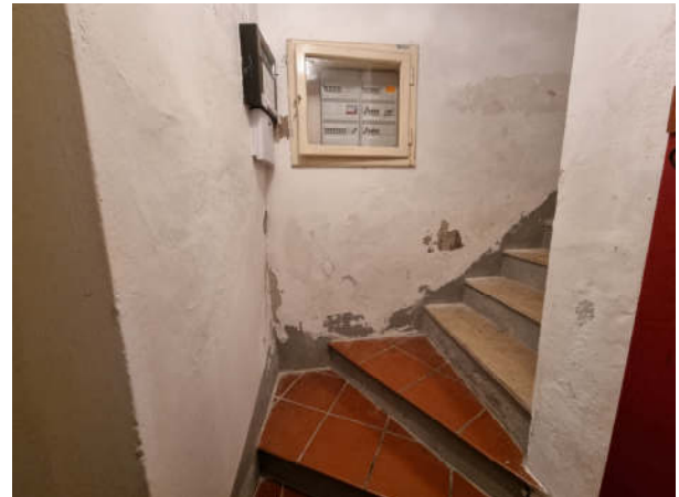
Stiegenhaus: EG – 1.OG