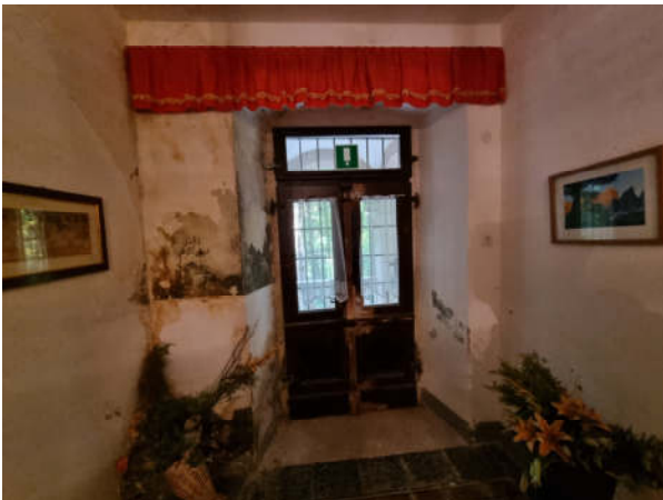
Eingangsbereich: 1. OG